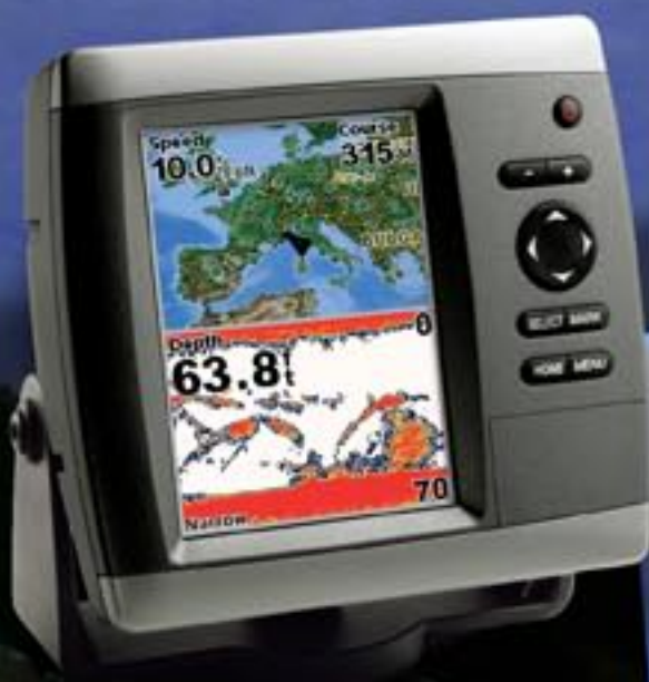
GPS kaartplotter voor zeilers