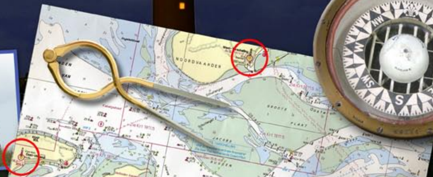
Zeekaart en kompas