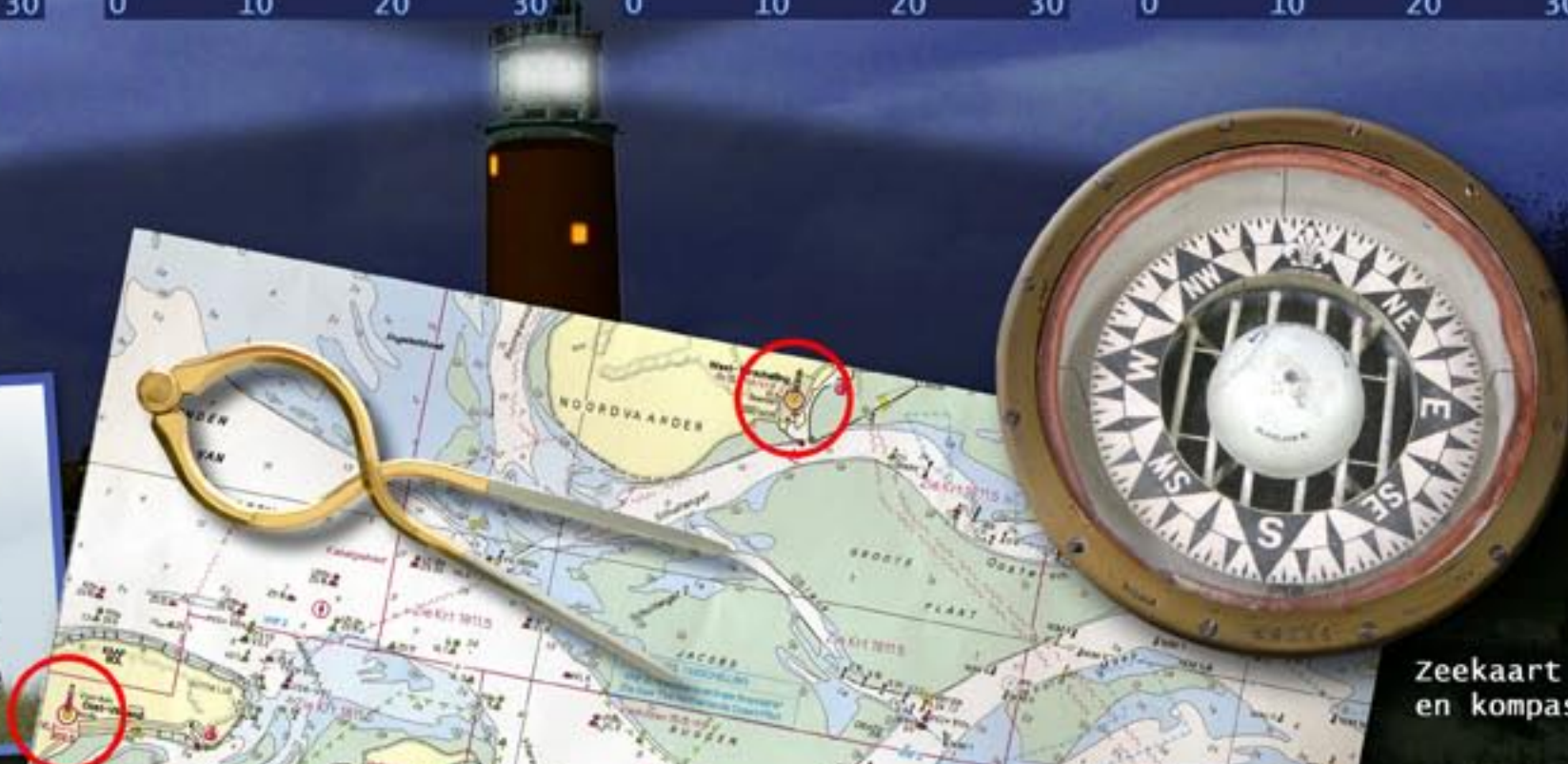
Zeekaart en kompas