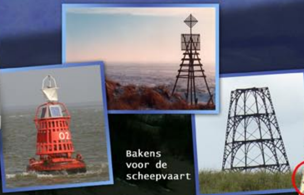
Bakens voor de scheepvaart