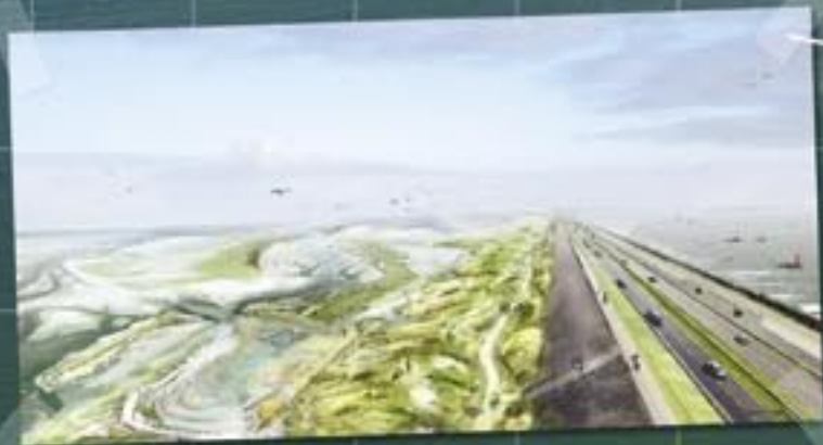
Kwelders aan waddenkant met fietspad