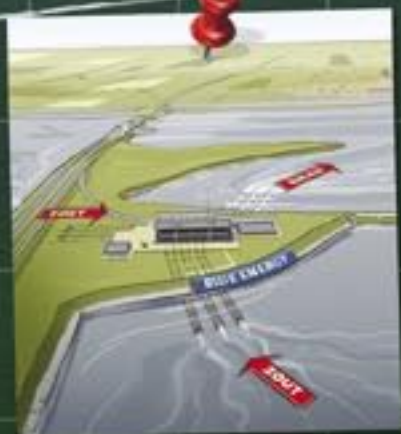
Blue energy uit contact tussen zoet en zout water en uit getijdenturbines.