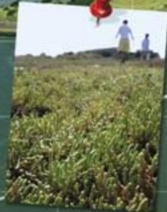
Zilte teelt (bijv. zeekraal)