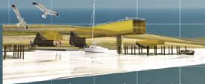
Woningbouw in de dijk